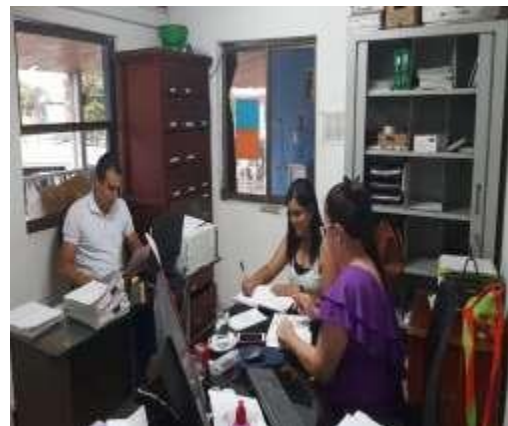
Anexo 3: Evidencia Fotográfica